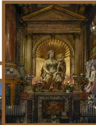
Madonna del Parto, Basilica dei Santi Trifone e Agostino, Piazza di S. Agostino, Roma